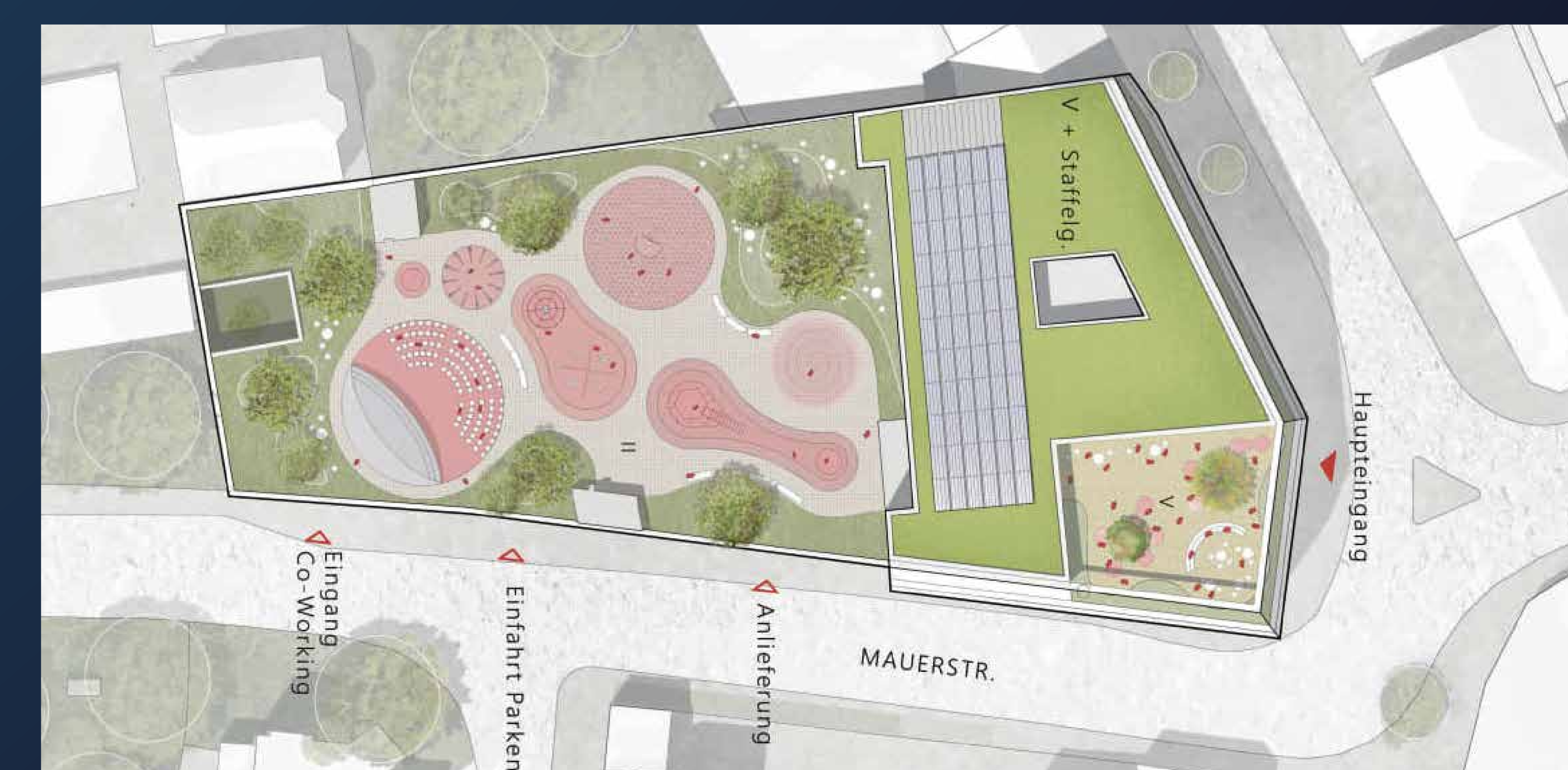
Das Rupprecht-Haus aus der Vogelperspektive (Entwurf: ATP Frankfurt Planungs GmbH)

kann es nicht geben. Das hat sicher etwas Zeit gekostet, aber jetzt haben wir einen Entwurf, hinter dem die Bürgerschaft wirklich steht.“ Auch die Wirtschaftlichkeit des Umbaus ist intensiv durchgerechnet: Die Stadtverwaltung hat unterschiedliche Szenarien durchgespielt und gezeigt: Der Umbau des Rupprecht-Hauses ist nicht nur sinnvoll, er ist auch wirtschaftlicher als mögliche Alternativen.